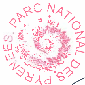
Marc TISSEIRE Directeur du Parc national des Pyrénées

Parc National des Pyrénées - villa Fould - 2, rue du IV septembre - boîte postale 736 - 65017 TARBES CEDEX