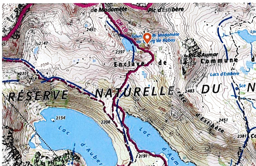
Carte extraite de la demande d'autorisation