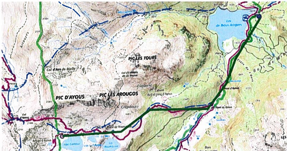
Figure 1 : Plan de vol proposé pour aller au lac de Gentau (DZ: violet, Parcours: Vert)