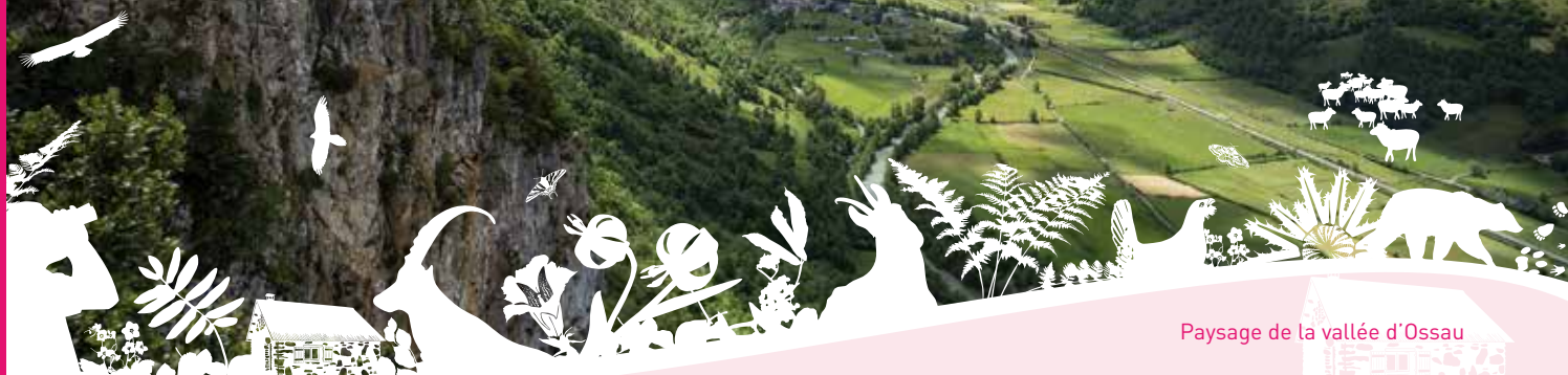
Paysage de la vallée d'Ossau

Les paysages des vallées du Parc national des Pyrénées sont magnifiques et variés. Ils sont composés d'éléments naturels (montagnes, forêts, glaciers, lacs,...) ou artificiels liés aux activités humaines (villages, moulins, granges, prairies, centrales hydroélectriques et barrages,...). Ces paysages constituent le patrimoine paysager et bâti. Les connais-tu vraiment ?