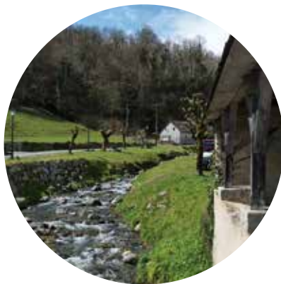
Canal d'irrigation et lavoir, Bielle, vallée d'Ossau

Les paysages de montagne, même s'ils paraissent paisibles et immobiles, sont en mouvement constant. Ils évoluent au cours du temps sous l'effet de phénomènes naturels, climatiques ou géologiques. Les intempéries modifient les paysages sur de longues périodes en érodant les reliefs tandis que d'autres les modifient plus rapidement. C'est le cas des séismes ou encore des crues.