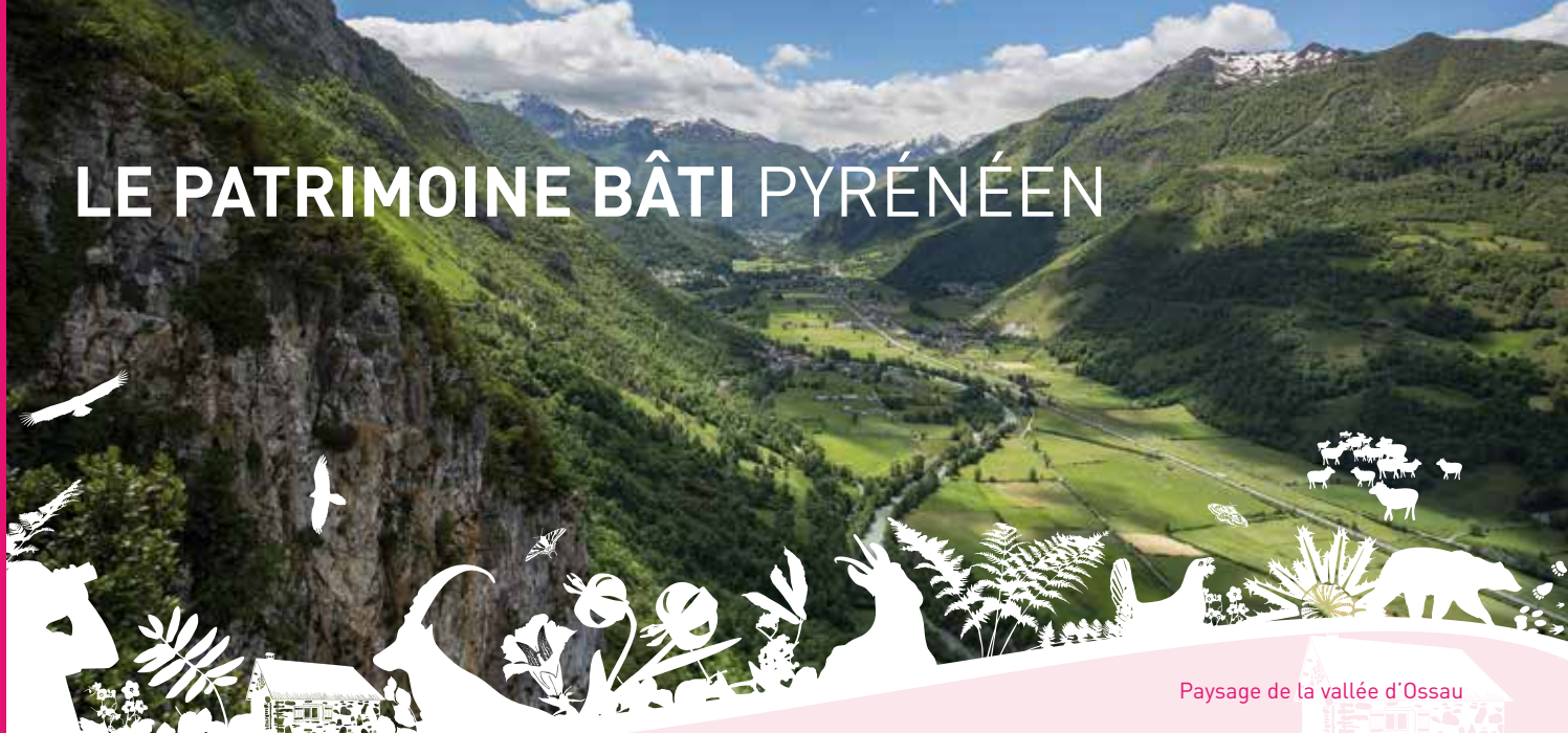
Paysage de la vallée d'Ossau

Les paysages des vallées du Parc national des Pyrénées sont magnifiques et variés. Ils sont composés d'éléments naturels (montagnes, forêts, glaciers, lacs,...) ou artificiels liés aux activités humaines (villages, moulins, granges, prairies, centrales hydroélectriques et barrages,...). Ces paysages constituent le patrimoine paysager et bâti. Les connais-tu vraiment ?