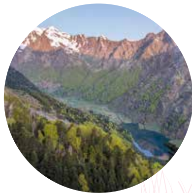
Lac et vallée d'Estaing, val d'Azun

Les paysages sont comme des livres, ils retracent l'histoire de l'homme et de son environnement, des milliers d'années à aujourd'hui. Apprendre à les observer, à les « lire » est un moyen de découvrir cette histoire.