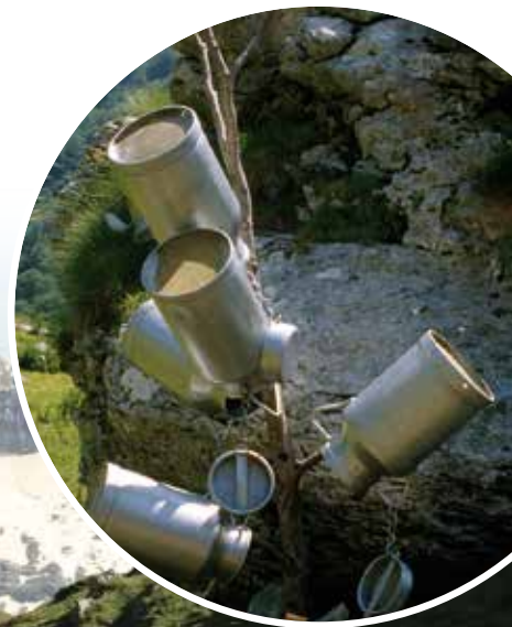
Bidons servant à stocker le lait avant la fabrication des fromages, vallée d'Aspe