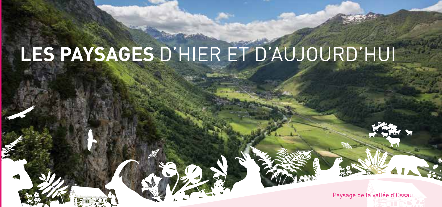
Paysage de la vallée d'Ossau

Les paysages des vallées du Parc national des Pyrénées sont magnifiques et variés. Ils sont composés d'éléments naturels (montagnes, forêts, glaciers, lacs,...) ou artificiels liés aux activités humaines (villages, moulins, granges, prairies, centrales hydroélectriques et barrages,...). Ces paysages constituent le patrimoine paysager et bâti. Les connais-tu vraiment ?