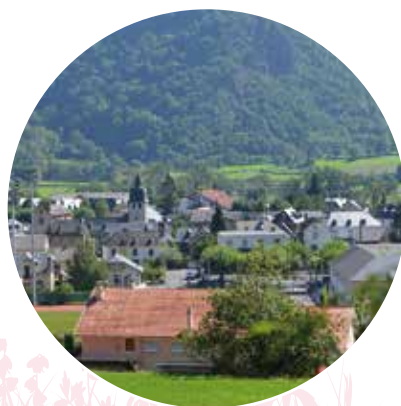
Commune de Pierrefitte-Nestalas, vallée de Cauterets

La construction de bâtiments est soumise à une réglementation stricte, on ne peut par exemple pas construire n'importe où sa maison. Un document fixe les règles d'aménagement et d'utilisation des sols : c'est le Plan Local d'Urbanisme (PLU). Il permet aux communes de fixer les règles d'aménagement et d'utilisation des sols. Tu peux le consulter librement dans la mairie de ta commune. La mise en place de ce document nécessite une étude préalable des besoins de la commune mais également des risques naturels.