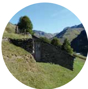
Alat, vallée de Barèges, vallée de Luz-Gavarnie

Le patrimoine bâti pyrénéen est très riche, il est le reflet des contraintes liées à la vie en montagne mais également des activités de l'homme ( pastoralisme ). Il est omniprésent dans tous les villages sous forme de murets, de chemins ou encore d'abreuvoirs. A côté de tout cela, il ne faut pas oublier les nombreuses installations industrielles et touristiques telles que les barrages ou encore les thermes.