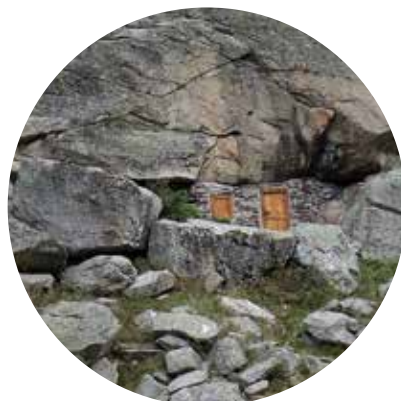
Toue du Larribet, val d'Azun

Ces constructions simples servaient également à déposer le lait ou le fromage avant l'affinage en plaine. Présentes dans toutes les vallées, on les appelle les courtaous dans le Haut-Adour, et coueylas en Pays Toy (vallée de Luz-Gavarnie).