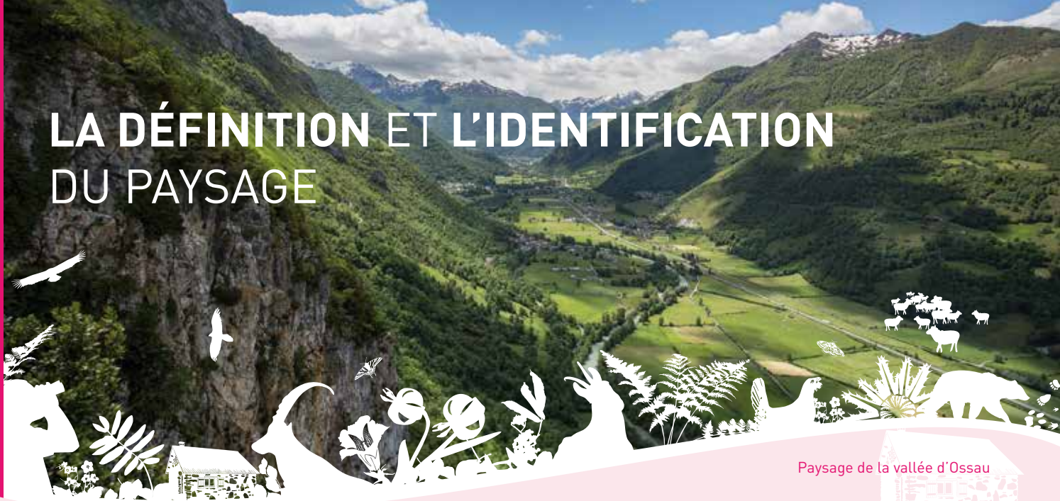
Paysage de la vallée d'Ossau

Les paysages des vallées du Parc national des Pyrénées sont magnifiques et variés. Ils sont composés d'éléments naturels (montagnes, forêts, glaciers, lacs,...) ou artificiels liés aux activités humaines (villages, moulins, granges, prairies, centrales hydroélectriques et barrages,...). Ces paysages constituent le patrimoine paysager et bâti. Les connais-tu vraiment ?