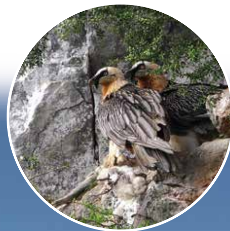
Couple de Gypaète barbu

Délimitation de la zone de quiétude du Grand tétras, vallée d'Aspe