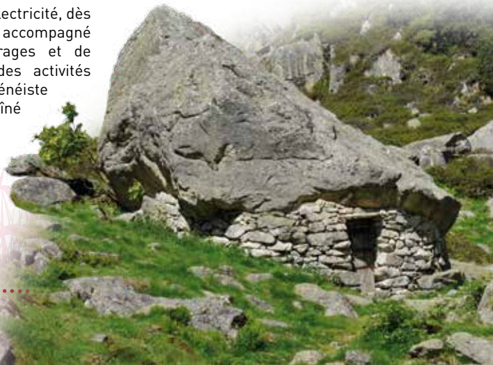
Toue de Doumblas, val d'Azun

Le développement de l'hydroélectricité, dès le début du XX ème siècle, s'est accompagné de la construction de barrages et de conduites forcées. L'essor des activités touristiques, de la période pyrénéiste à aujourd'hui, a lui aussi entraîné d'importants changements. Les petits bourgs se sont en effet peu à peu transformés en villes, les routes ont fait leur apparition.