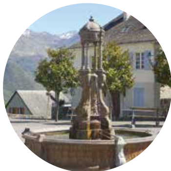
Fontaine, Saint-Savin, vallée de Cauterets

Le patrimoine bâti pyrénéen est très riche, il est le reflet des contraintes liées à la vie en montagne mais également des activités de l'homme ( pastoralisme ). Il est omniprésent dans tous les villages sous forme de murets, de chemins ou encore d'abreuvoirs. A côté de tout cela, il ne faut pas oublier les nombreuses installations industrielles et touristiques telles que les barrages ou encore les thermes.