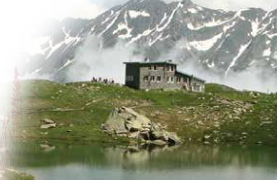
Refuge de Pombie, vallée d'Ossau

Toutes les époques ont laissé derrière elles des constructions qui font de nos vallées des lieux d'exception (bâtiments de style architectural du Second Empire au XIXème siècle, développement d'infrastructures hydroélectriques au début du XXème siècle,...). Du point de vue du patrimoine bâti, les vallées pyrénéennes sont des musées à ciel ouvert. Recenser et étudier ce patrimoine est un moyen de voyager dans le temps.