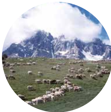
Brebis en estives

Comment sont composés les paysages ? Comment les étudier ? Il faut d'abord les observer. En fonction de l'endroit où tu te trouves dans la vallée, tu n'observeras pas les mêmes paysages. Un paysage correspond à l'ensemble de tout ce que tu peux observer autour de toi : le relief, la végétation, les manifestations des activités humaines.