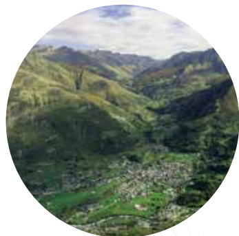
Luz Saint-Sauveur et la vallée de Barèges

Les vallées pyrénéennes sont des vallées glaciaires structurées en quatre grands ensembles :