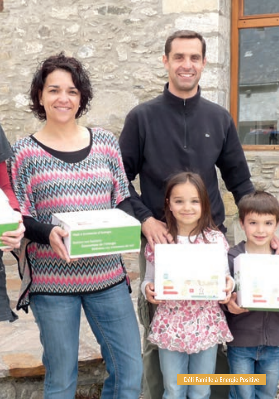
Défi Famille à Energie Positive