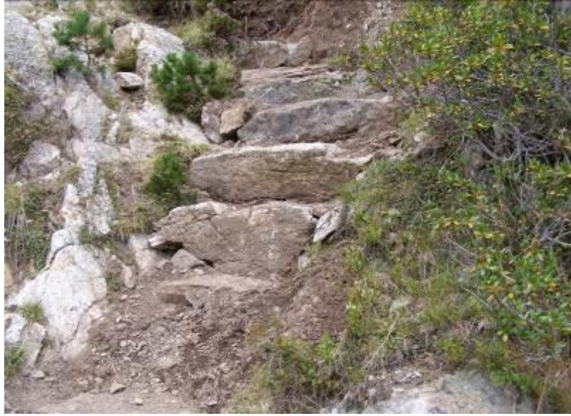
Exemples de réalisations de « blocages / emmarchements »