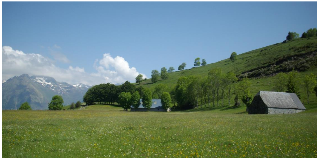
Concours prairies fleuries 2011 : Prix Paysager, Artalens Souin

Depuis 2009, le Parc national des Pyrénées a mis en place, avec le soutien de la profession agricole des Hautes-Pyrénées, une Mesure Agri-Environnementale Territorialisée (MAET), ciblée sur ces prairies fleuries. Cette mesure rétribue les éleveurs pour la biodiversité de leurs parcelles, et permet le maintien de leurs pratiques. Par ce programme, le Parc national des Pyrénées souhaite valoriser cette agriculture de montagne qui conjugue biodiversité, paysages et produits de qualité.