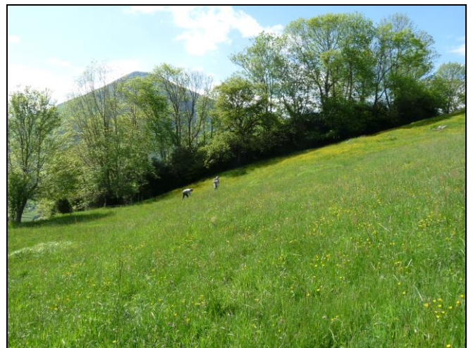
Concours prairies fleuries 2014 : Prix reconquête du paysage, Bedous

Harmonie des formes et des couleurs, paysages, présence de granges foraines ou de murets, les prairies sont les témoins de l'histoire et de l'héritage des vallées. Aussi, elles seront également évaluées par des géographes paysagistes.