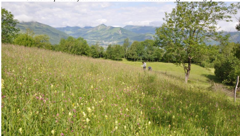
Concours prairies fleuries 2011 : Prix d'Excellence Agri-Ecologique

De la même manière, en 2009, la campagne de lutte contre le campagnol terrestre par piégeage a également bénéficié d'un soutien fort du Parc national des Pyrénées. Cette campagne a utilisée des méthodes traditionnelles de piégeages non polluantes, et a permis la préservation de la ressource fourragère.