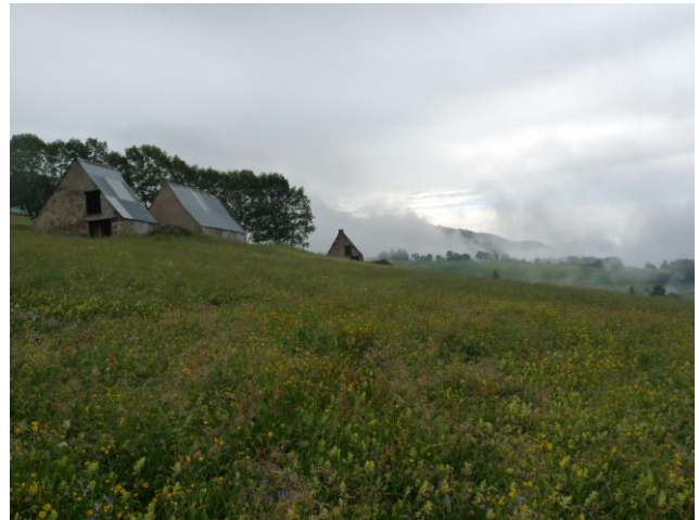
Concours Prairies fleuries 2012 : Prix d'excellence, Campan

On peut les rencontrer sur les versants, les bords de gave, les croupes ou les sommets... Ainsi, elles regroupent une grande diversité de milieux naturels : prairies humides, prairies sèches, jusqu'aux pelouses si le sol est superficiel (couche de terre peu épaisse).