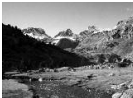
Plateau du Cayan