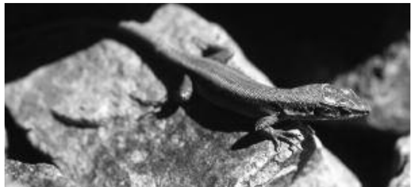
Lézard des Pyrénées

Depuis 2001, 8 documents d'objectifs pour les sites « Néouvielle », « Péguère, Barbat, Cambalès », « Estaubé, Gavarnie, Troumouse, Barroude », « Gaube, Vignemale », « Gabizos », « Pic Long, Campbielh » et « Ossoue, Aspé, Cestrède » et la Zone de Protection Spéciale du cirque de Gavarnie au titre de la Directive « Oiseaux » ont été confiés, dans le département des Hautes-Pyrénées, au Parc national des Pyrénées.