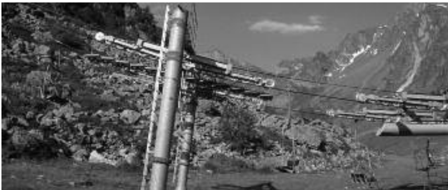
Pylônes de lignes électriques

La cabane métallique rouge du secteur de Bastan est aujourd'hui le dernier point noir paysager du secteur et un point de fixation de déchets qu'il conviendra de traiter.