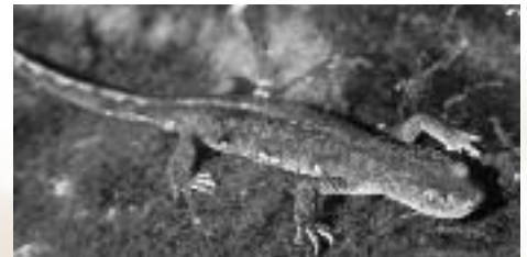
Euproctes des Pyrénées

L'élaboration du document d'objectif (Docob) sera poursuivie en 2008. il s'agira alors de définir et d'évaluer financièrement les actions à mettre en œuvre afin de préserver les habitats et les espèces. La rédaction et la validation du Docob ont été terminées à la fin du mois de mai 2008.