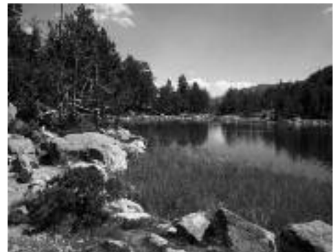
Réserve naturelle du Néouvielle