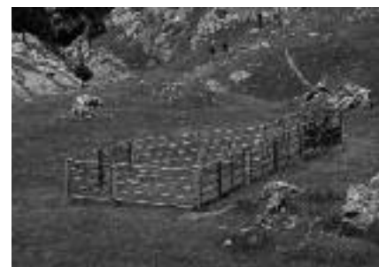
Parc de tri