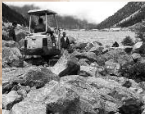
Sentier de Gaube

Le Sivom de Labat de Bun a réalisé la restauration de la cabane des Masseys. Le Parc national des Pyrénées a financé ce projet à 80%. La cabane du Clot, réhabilitée en 2006, est désormais réservée au berger.