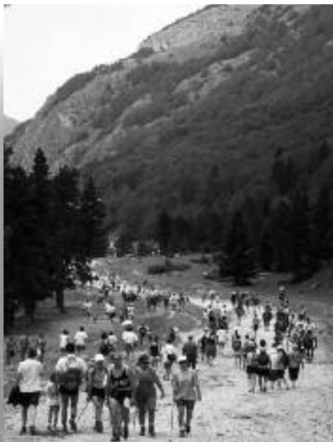
Sentier du cirque de Gavarnie

L'aménagement des sentiers sur les sites Natura 2000 intègre des problématiques telles que les dégradations sur les milieux ou le dérangement des oiseaux. Sur le chemin du cirque de Gavarnie, les travaux se sont poursuivis avec la rénovation d'une passerelle. L'aménagement de l'accès à la Montagne de Camplong et à la cabane de l'Aquila est en cours de réflexion. Suite à une réunion de travail avec les acteurs locaux, la réouverture du sentier de la Hourcade est apparue peu pertinente. Une restauration du sentier de l'Aquila semblerait plus intéressante. La création d'un sentier thématique autour du barrage des Gloriettes est en projet. Il viendrait compléter le sentier de Ramond qui permet de relier le village au lac des Gloriettes, réhabilité par la commune de Gèdre. Afin de limiter le dérangement des galliformes de montagne (Perdrix, Grand Tétrás, Lagopèdes), un léger déplacement du sentier traversant le Bois du Bourlic (Gavarnie) est envisagé, ainsi qu'une information aux accompagnateurs de montagne et randonneurs hivernaux.