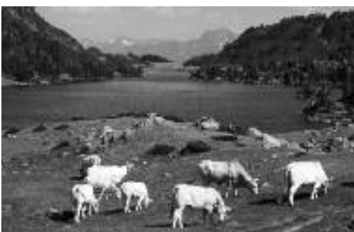
Réserve naturelle du Néouvielle

Des héliportages pour les bergers et un point d'abreuvement pour les troupeaux sur Tramerous sont prévus en 2008.