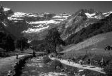
Cirque de Gavarnie

« Ossoue, Aspé, Cestrède », « Gavarnie, Estaubé, Troumouse, Barroude » « Zone de Protection Spéciale du cirque de Gavarnie »