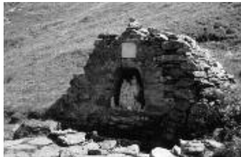
Vierge de l'Aquila