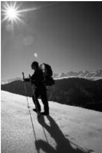
Randonneur à ski