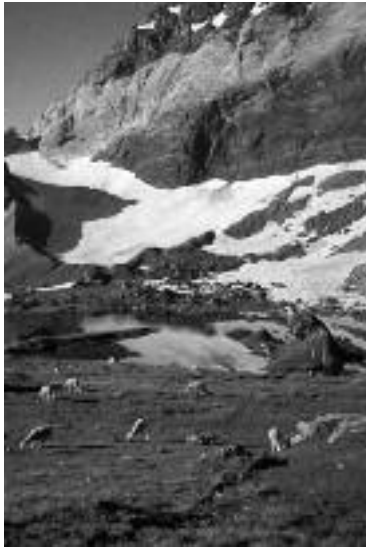
Muraille de Barroude