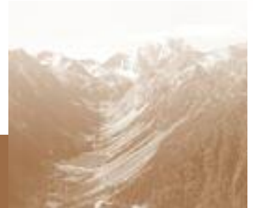
Vallée de Gaube