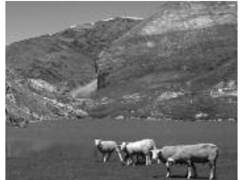
Troumouse - Lac des Aires

Actuellement, quatre sites sont ainsi animés par des collectivités. Le financement de ces animations est assuré par la DIREN Midi-Pyrénées (Direction Régionale à l'Environnement) et la DDAF des Hautes-Pyrénées (Direction Départementale de l'Agriculture et de la Forêt). Une convention de partenariat entre les collectivités locales et le Parc national des Pyrénées viendra prochainement formaliser cet appui.