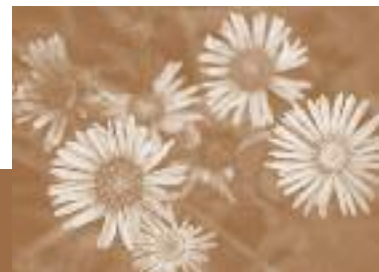
Aster des Pyrénées

La phase d'élaboration qui vient de s'achever a permis à l'ensemble des acteurs de s'impliquer dans une démarche constructive et collective.