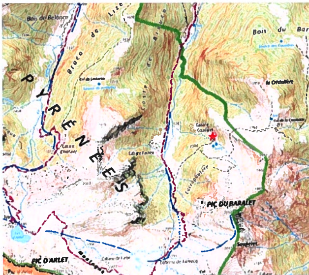
★ Lieu de la cabane de Couylaret, commune de Borçes

La localisation de l'intervention est précisée ci-après (rouge).