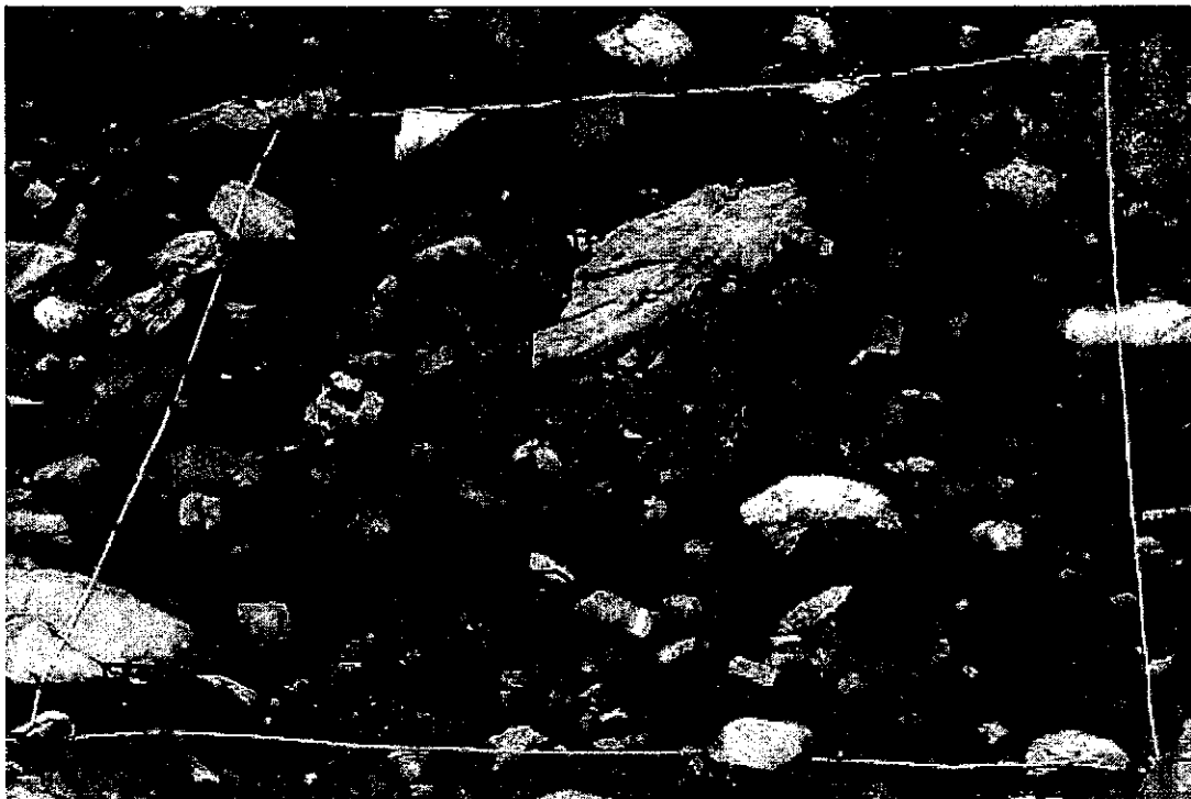
Figure 2 : station de suivi de combe à neige au Pic du Midi de Bigorre (3x3 m), suivi par le CBNPMP.

Une description phytosociologique exhaustive des toutes les associations végétales en contact avec la végétation du Salicion herbaceae , sera réalisée lors de la mise en place du suivi. Le but est de connaître le contexte phytosociologique global de la combe à neige. Cette première observation visera la période optimale d'expression de la végétation et pourra être affinée lors des visites suivantes.